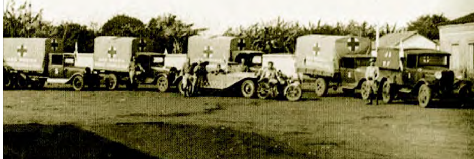
Caminhões Ambulâncias prontos para partirem para as frentes de combate das Forças Constitucionalistas em São Paulo. Alguns dos caminhões são Chevrolet e outros Ford

Bill com os Estados Unidos, em 1941, quando o Brasil passou a receber veículos militares modernos em grande quantidade e que se tornaram a espinha dorsal do Exército até meados dos anos 70, quando foram sendo substituídos por veículos militares e militarizados produzidos pela Indústria Bélica Brasileira, voltando a partir dos anos 90 a importar alguns tipos de veículos, tanto da Europa quanto dos Estados Unidos.