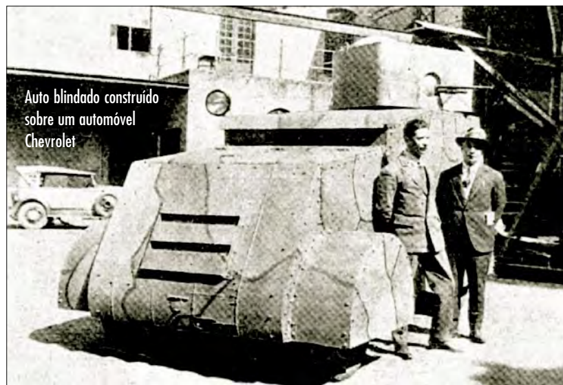
Auto blindado construído sobre um automóvel Chevrolet