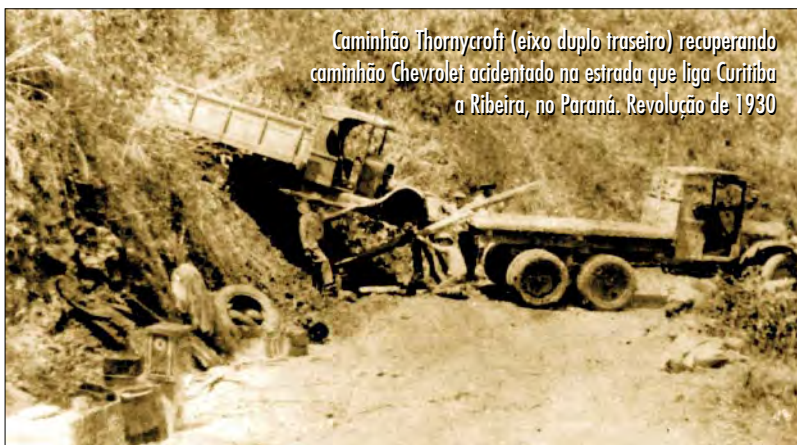
Caminhão Thornycroft (eixo duplo traseiro) recuperando caminhão Chevrolet acidentado na estrada que liga Curitiba a Ribeira, no Paraná. Revolução de 1930

valos – hipomóveis . No caso da artilharia, os canhões muitas vezes eram transportados por junta de bois, coisa comum até final dos anos 30.