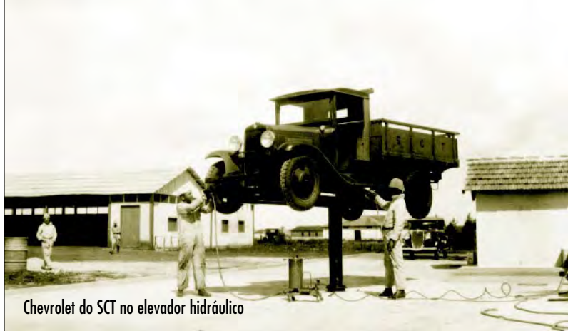
Chevrolet do SCT no elevador hidráulico

Havia uma pequena quantidade de veículos motorizados no Exército e boa parte das unidades ainda estava equipada com viaturas tracionadas por ca-