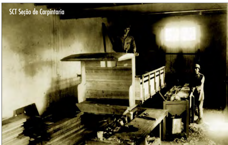
SCT Seção de Carpintaria