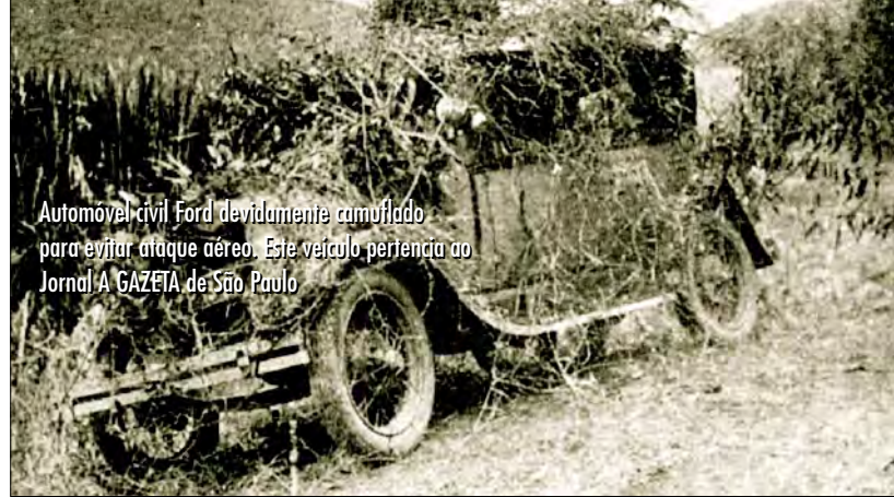
Automóvel civil Ford devidamente camuflado para evitar ataque aéreo. Este veículo pertencia ao Jornal A GAZETA de São Paulo

O ato que mais demonstra a importância da motorização para as forças constitucionalistas talvez tenha sido a reabertura da fábrica da General Motors do Brasil em São Caetano do Sul, SP, fechada pela diretoria ao eclodir a revolução. O governo paulista adquiriu todo o estoque de veículos da empresa, mesmo os modelos