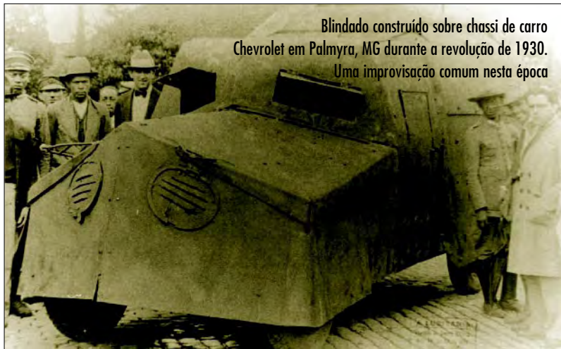
Blindado construído sobre chassi de carro Chevrolet em Palmyra, MG durante a revolução de 1930. Uma improvisação comum nesta época