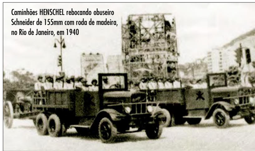
Caminhões HENSCHEL rebocando obuseiro Schneider de 155mm com roda de madeira, no Rio de Janeiro, em 1940