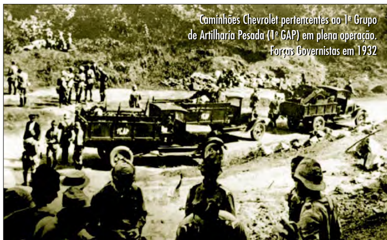
Caminhões Chevrolet pertencentes ao 1º Grupo de Artilharia Pesada (1º GAP) em plena operação. Forças Governistas em 1932