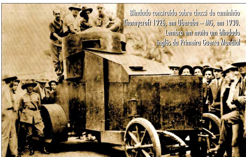
Blindado construído sobre chassis de caminhão Thornycroft 1926, em Uberaba – MG, em 1930. Lembra em muito um blindado inglês da Primeira Guerra Mundial