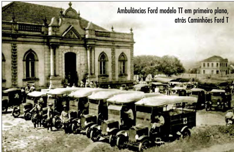
Ambulâncias Ford modelo TT em primeiro plano, atrás Caminhões Ford T