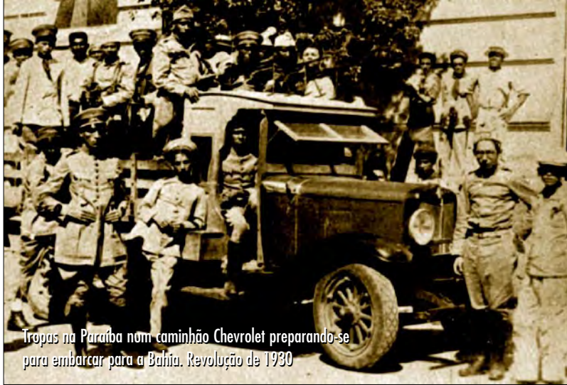
Tropas na Paraíba num caminhão Chevrolet preparando-se para embarcar para a Bahia. Revolução de 1930