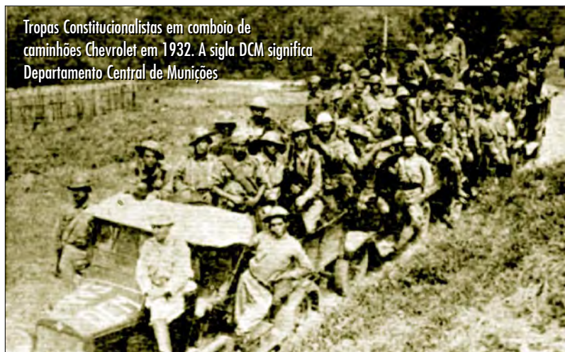
Tropas Constitucionalistas em comboio de caminhões Chevrolet em 1932. A sigla DCM significa Departamento Central de Munições