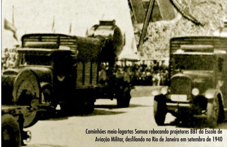
Caminhões meia-lagartas Somua rebocando projetores BBT da Escola de Aviação Militar, desfilando no Rio de Janeiro em setembro de 1940

internacional são as circunstâncias que nos levam a duas conclusões insofismáveis, as quais não posso eximir-me de proclamar bem alto perante os homens de responsabilidade do país: