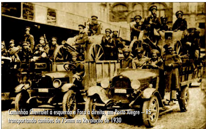
Caminhão Chevrolet à esquerda e Ford à direita, em Porto Alegre – RS transportando canhões de 75mm na Revolução de 1930