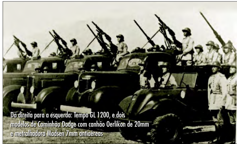
Da direita para a esquerda: tempo GL 1200, e dois modelos de Caminhão Dodge com canhão Oerlikon de 20mm e metralhadora Madsen 7mm antiaéreas